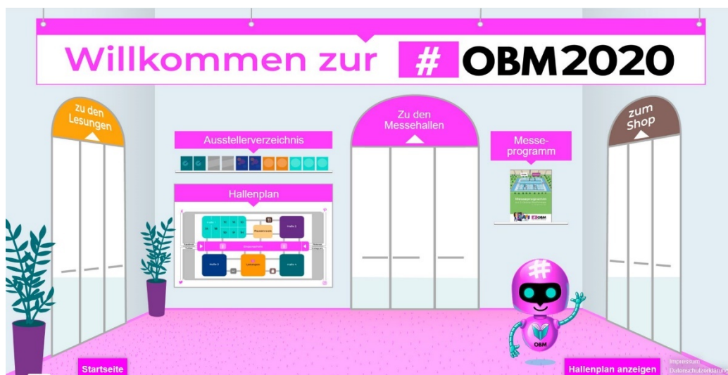
Abbildung 2: Eingangshalle

Im Folgenden verdeutlichen Screenshots die Webseite aus 2020.