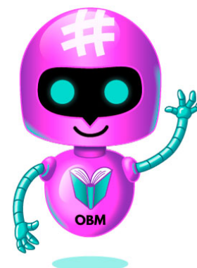
Abbildung 3: OBM-Maskottchen

Der Chatbot versendet nicht nur Auskünfte zu den einzelnen Autor:innen, Verlagen und den dazugehörigen Büchern, sondern verschickt bei Interesse auch Leseproben und Cover als Dateien. Diese können von den Leser:innen dann direkt an Freunde weitergeleitet werden.