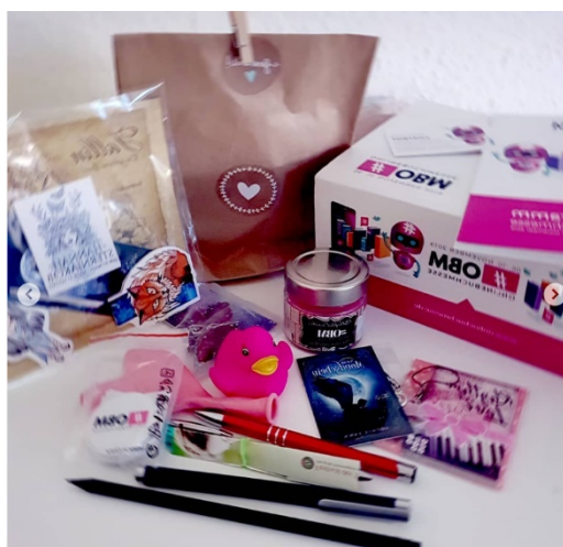
Abbildung 6+7: Lesezeichen und co.