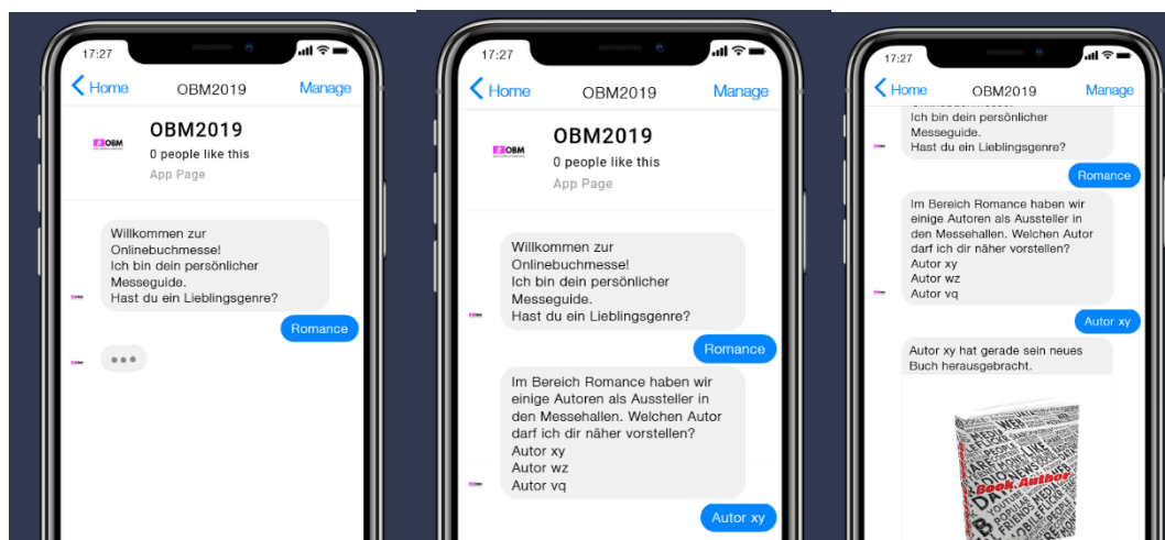
Abbildung 4: Beispiel-Chatbot-Szenario